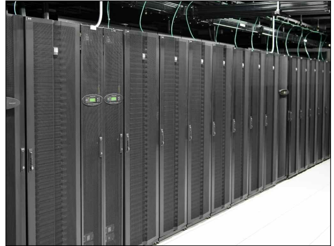
Una combinación de Gabinetes personalizados de GlobalFrame Serie GF proporcionó la columna vertebral para la implementación de una solución completa del Sistema de Contención de Pasillos Calientes (HAC) de CPI para Cologix, Inc.

Con una creciente presencia en América del Norte a través de ocho mercados, Cologix necesitaba una solución de alta calidad y económica para soportar y alojar el cableado estructurado, los productos de alimentación y los equipos de TI del cliente para una expansión del centro de datos en el hotel de la portadora Dallas INFOMART.