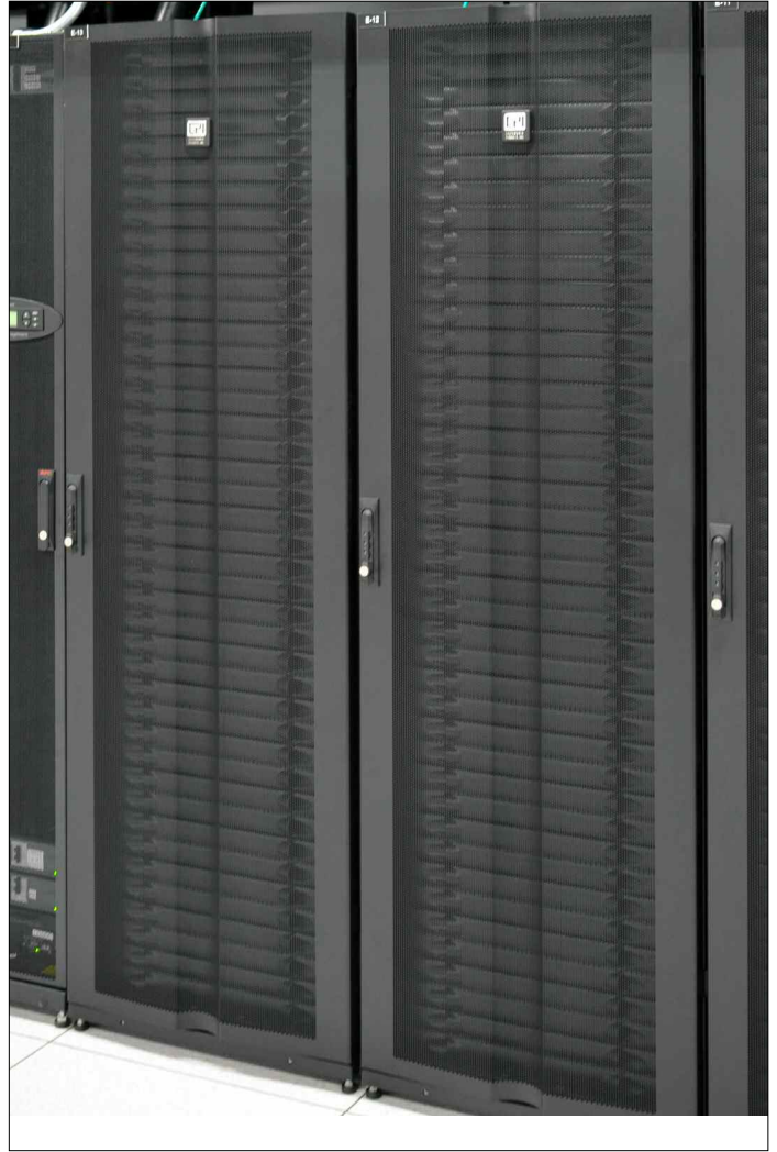
Se instalaron Gabinetes GlobalFrame Serie GF de CPI con puertas personalizadas, deflectores de soporte y Paneles Ciegos a Presión Hotlok® para mejorar la eficiencia del flujo de aire en el centro de datos en Dallas de Cologix.

Cada gabinete de GlobalFrame es su propia solución personalizada única. Por ejemplo, uno puede tener una cerradura mecánica, puertas específicas o ruedas. Los gabinetes alojan las soluciones de planta eléctrica de corriente directa en bastidor de Cologix, así como los equipos de los clientes, como servidores, routers y switches. "CPI tenía todas las características, y hemos sido capaces de crear un paquete específico para Cologix", dijo Spencer.