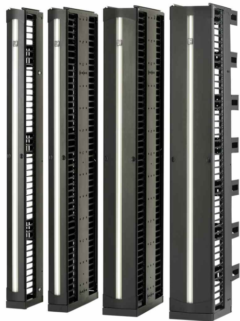
Los Administradores Verticales de Cables Evolution® de CPI (que se muestran aquí) instalados en Bastidores de Dos Postes se muestran en los "Meet-Me-Rooms" de Cologix.

Cologix también tiene "Meet-Me-Rooms" (Habitaciones de encuentro) en Toronto, Montreal, Vancouver, Minneapolis y Jacksonville que cuentan con Bastidores de Dos Postes de CPI con Administración de Cables Evolution®. Los Bastidores de Dos postes de CPI brindan soporte al equipo y al cableado con potencia, estabilidad y durabilidad inigualadas, mientras que la Administración de Cables de Evolution ofrece una