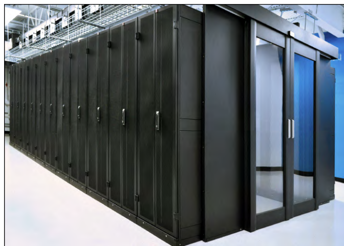
CAC 的门是加压密封环境的一个重要部件。

Hostirian 是 River City Internet Group ( www.rcig.net ) 的一个全资业务单元。Hostirian 于 2001 年成立于圣路易斯，目前通过多个运营商级的设施，提供优质、复杂的托管服务。他们的基本工作重点是个性化关注客户需求，提供全天候支持。Hostirian 的服务器和应用程序也得到专业人员和工程师全天候的监控 ( www.hostirian.com )。