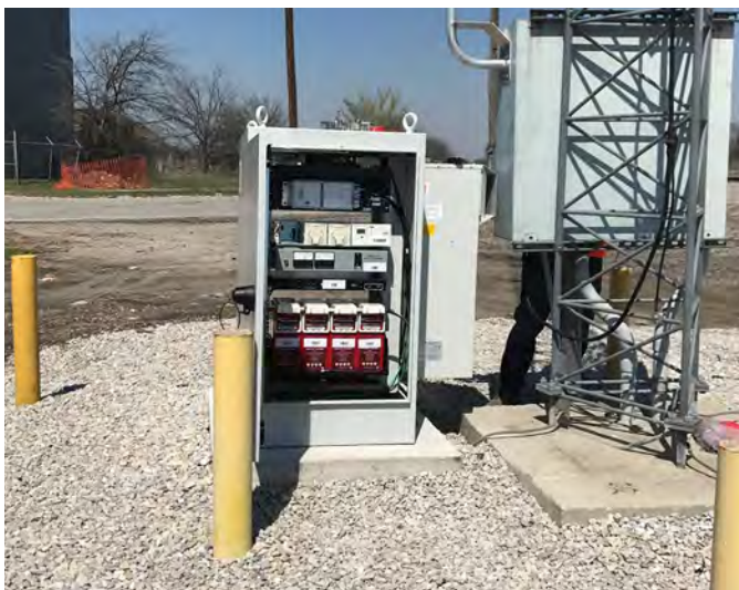
5G, Edge, IoT

技术无处不在，当您需要存储和保护将需要放置在污浊和潮湿环境中的宝贵 ICT 或电子设备时，请放心使用 CPI 的 RMR® 工业机箱解决方案。