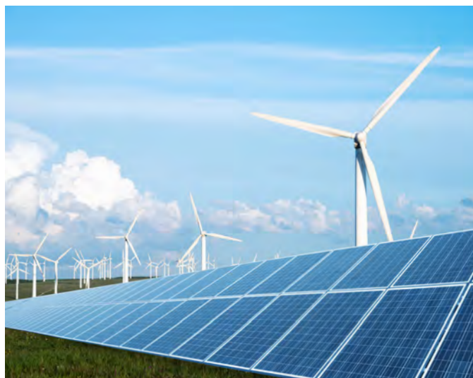
绿色电力，工业基础设施